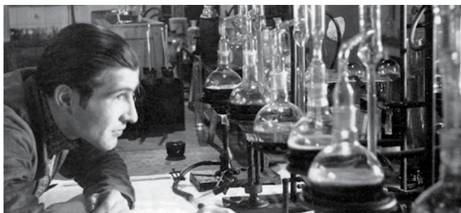
Minevik ja tänapäev – teadus- ja arendustöö on olnud meie ettevõttes alati kesksel kohal.

ADDINOL — одно из немногих независимых от крупных концернов предприятий в нефтеперерабатывающей промышленности Германии. Работая с дилерами и партнерами более чем в 90 странах мира, мы представлены на всех континентах. Наши высокоэффективные смазочные материалы нового поколения — важные конструктивные элементы разной техники. Научно-исследовательская деятельность и производство, отвечающие последним стандартам, сосредоточены в немецком городе Лойна — традиционном центре химической промышленности. Взаимодействуя с двигателями, приводами, цепями, подшипниками и гидравлическими системами, смазочные материалы полностью раскрывают свои достоинства.