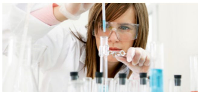
Научно-исследовательские разработки всегда занимали важное место в деятельности нашей фирмы.

ADDINOL предлагает высокотехнические решения, обеспечивающие оптимальную смазку и заботу об окружающей среде. Многие наши качественные смазочные материалы существенно улучшают энергоэффективность установок и двигателей. Наши смазочные материалы значительно превосходят обычную продукцию по срокам службы; они повышают сроки эксплуатации смазываемых компонентов.