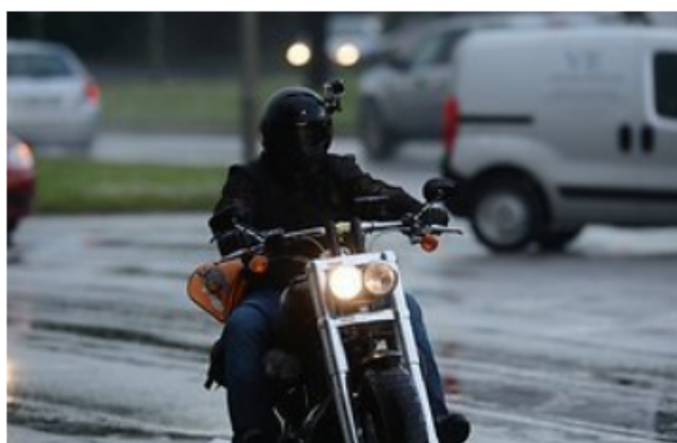
Pilt on illustreeriv

Kevadisel hooldusel on rehvide, pidurite ja värske kütuse kõrval oluline roll ka õli- ja õlifiltrivahetusel ning keti määrimisel.